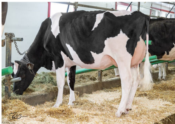
DENISTIER APPS DEMOISELLE DAUGHTER