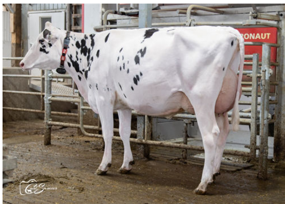
LEHOUX APPS RAIZ DAUGHTER