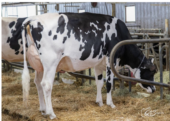
RAYPIEN APPS ANMONY DAUGHTER